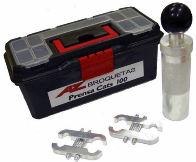
Prensa manual Cats 100