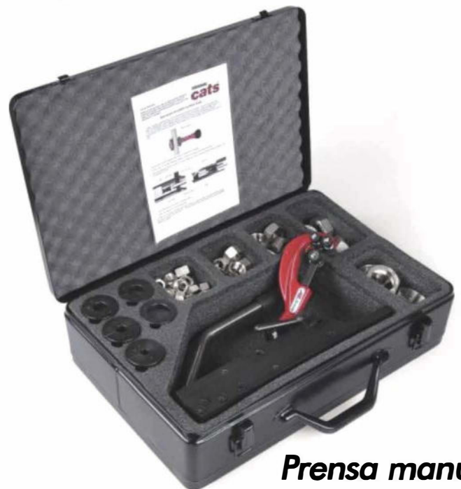
Prensa manual Cats 120